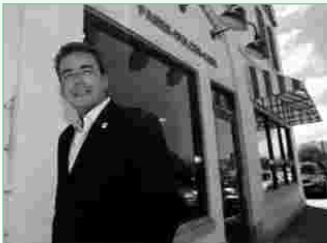
Su éxito es objeto de estudios en Babson Collage.

La cadena local de restaurantes El Meson, anunció la apertura de tres tiendas este año y otras tres en el 2011. La inversión en las primeras tres localidades asciende a $2.5 millones y ubicarán en Montehiedra Town Center (al lado de Marshalls) en Río Piedras, una frente al Museo de Arte de Puerto Rico en Santurce y la otra en la carretera