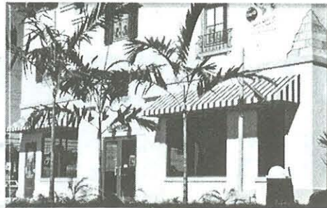
La elegancia y estilo dice presente en Hatillo II.