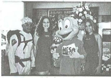
Titai posa junto a las bellas modelos de Coca-Cola y el joven Tea-Buster de Lipton Ice Tea.