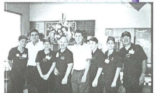
Los integrantes del Dream Team en Hatillo II.